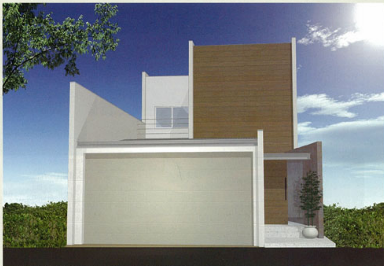
雑種プロジェクト外観パース。通常の建て売りでは考えられない凝りに凝った間取りにも注目